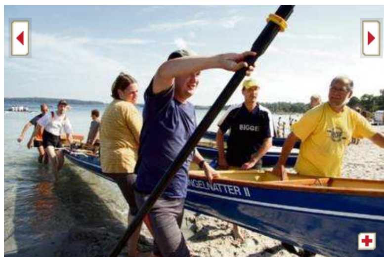
Letzter Kraftakt: Nach 80 Kilometern Ruderfahrt tragen die Sportler ihr Boot ins Vereinsheim.